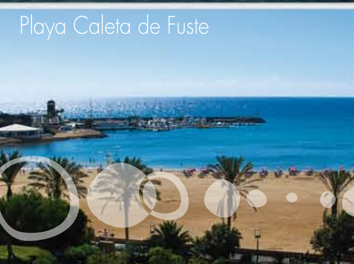
Playa Caleta de Fuste