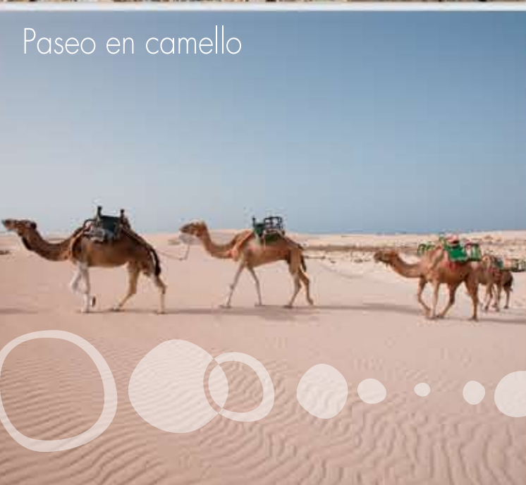
Paseo en camello