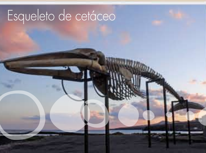
Esqueleto de cetáceo