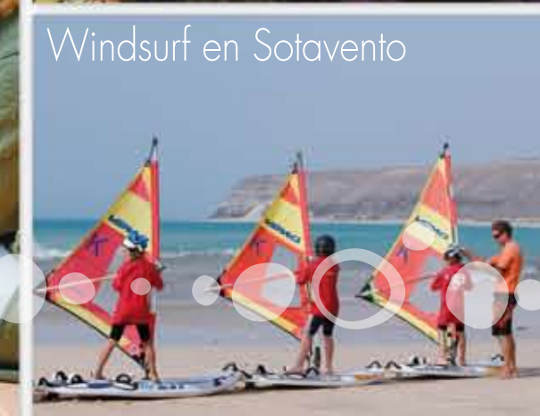
Windsurf en Sotavento