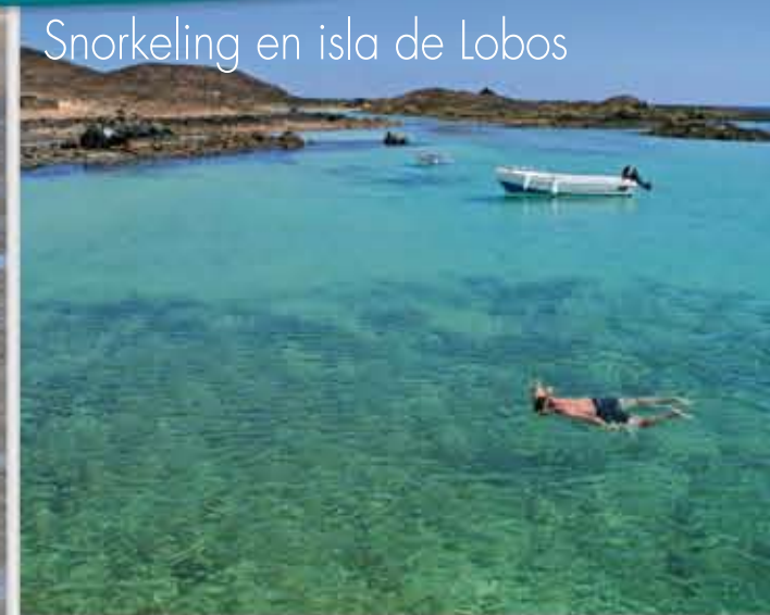
Snorkeling en isla de Lobos