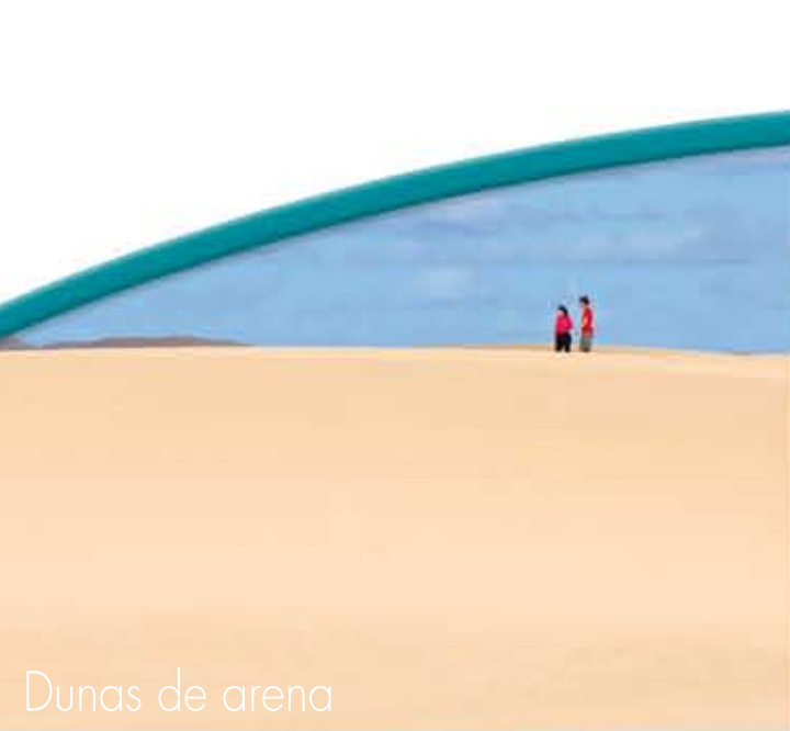
Dunas de arena