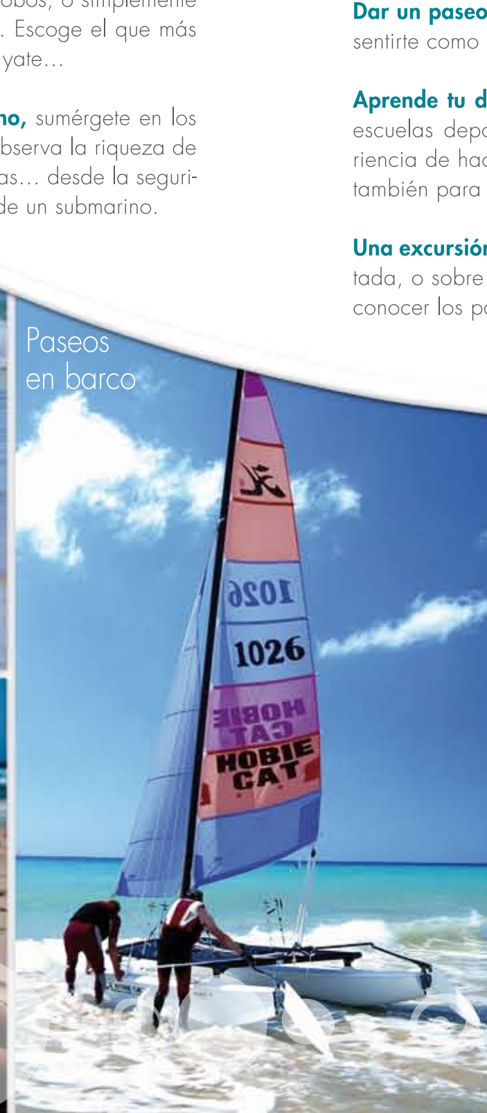
Paseos en barco