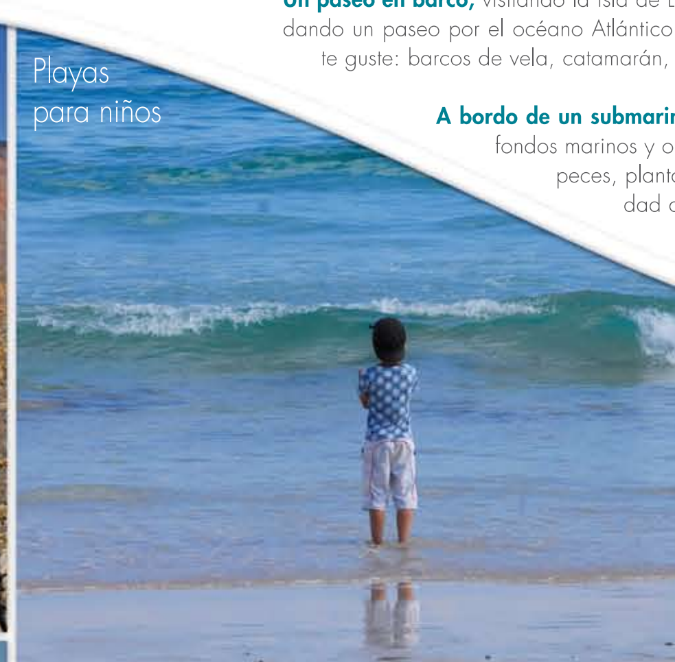
Playas para niños