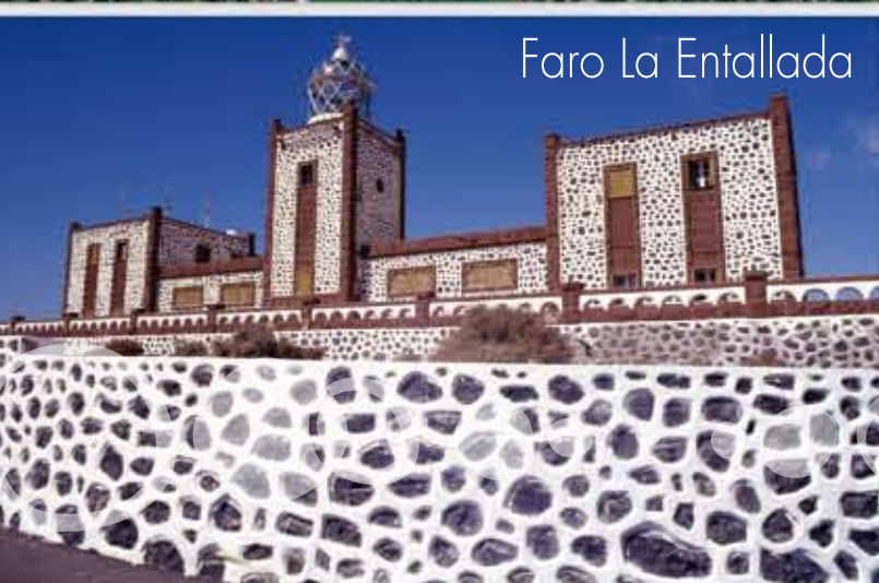
Faro La Entallada