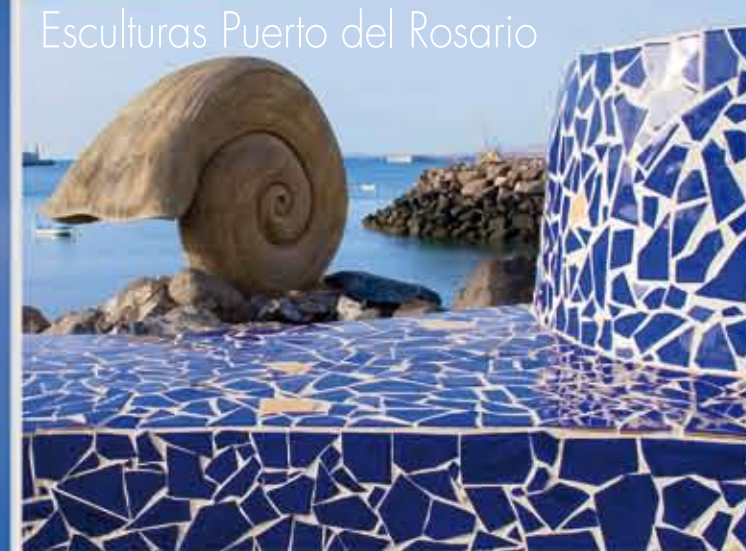
Esculturas Puerto del Rosario