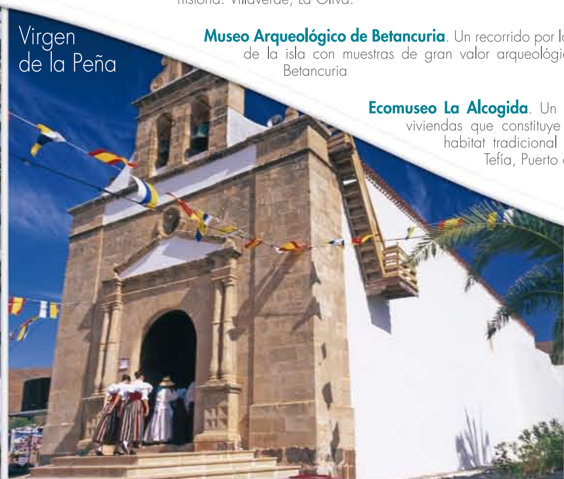
Virgen de la Peña