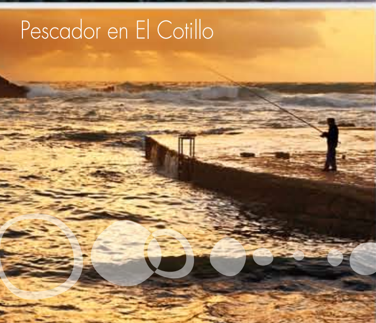
Pescador en El Cotillo