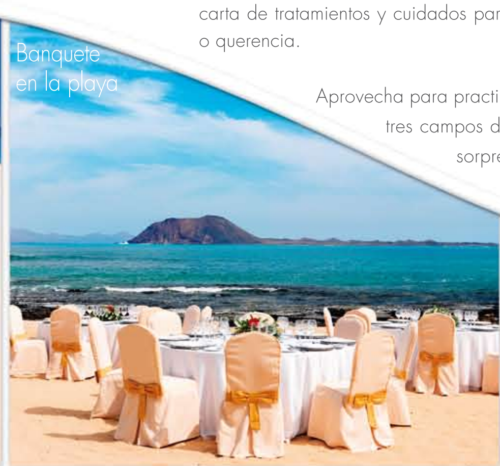
Banquete en la playa