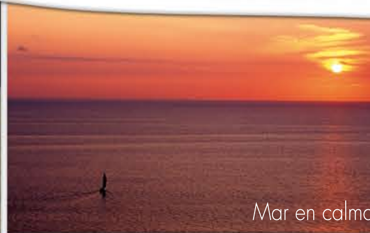
Mar en calma