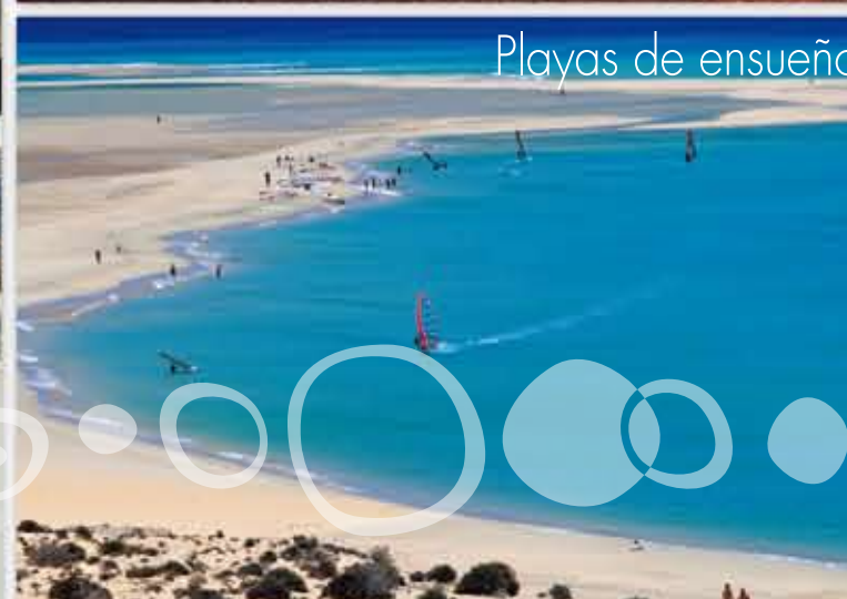
Playas de ensueño