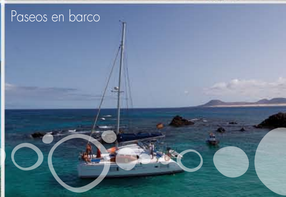
Paseos en barco